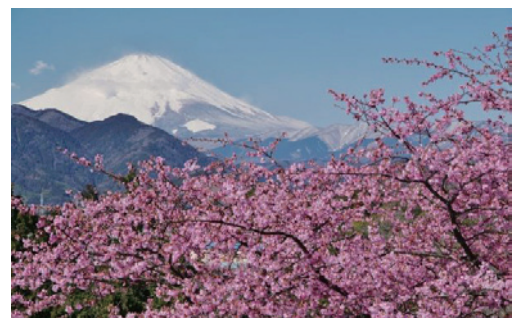
松田山からの富士山 ↑