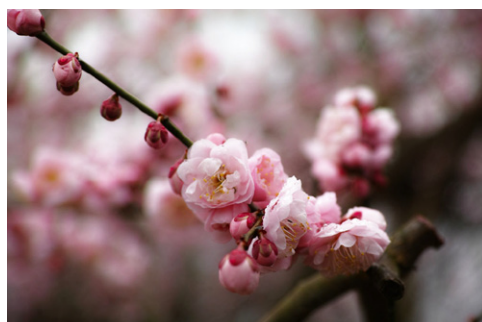
ウメ(楠玉?) 麓の民家の庭にて