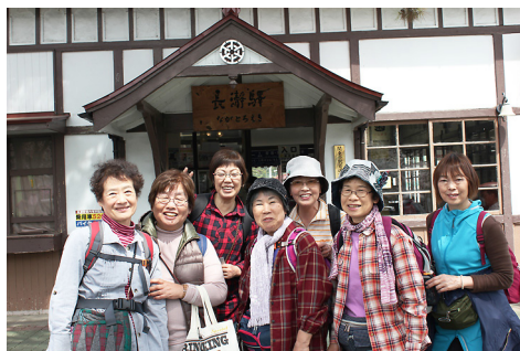
長瀬駅の前で。悠遊組メンバー ↑

前日までの花しぐれの気候とは違って変わり、まるで私たちを歓迎してくれるかの様な陽射しの中、花の秩父路へと出発です。会長と私たち悠遊組7人は寄居駅でハイク組と別れ、9時10分タクシー2台に分乗、岩根山へと向かいました。20分程で神社に到着、途中ハプニングがあり1台と別かれてしまいましたが、無事法善寺で合流しました。岩根神社の一面真っ赤なつつじやしだれ桜、花桃、れんげよう、長瀬までの長い桜並木が見事に私達に春爛漫を満喫させてくれました。長瀬では美味しいお蕎麦を賞味し、お土産のお買い物も済ま