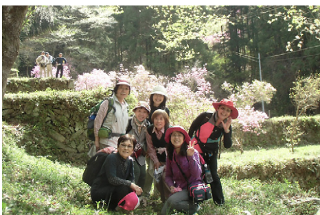
岩根山つつじ園にて ↑