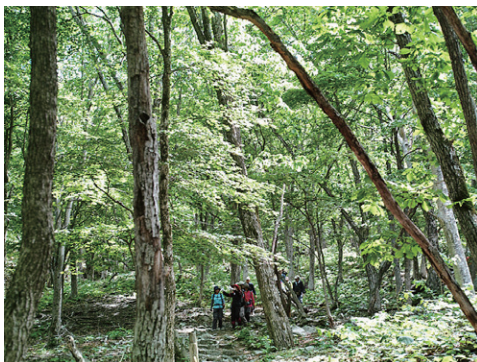
中禅寺湖付近の新緑↑