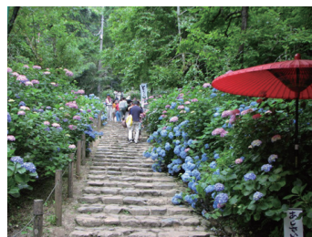
大平山あじさい坂↑