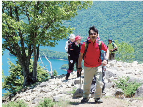
中禅寺湖を背景に(11:25)↑