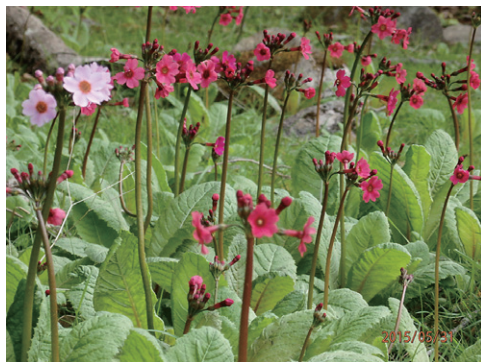
クリンソウ。中禅寺湖周遊道にて↑