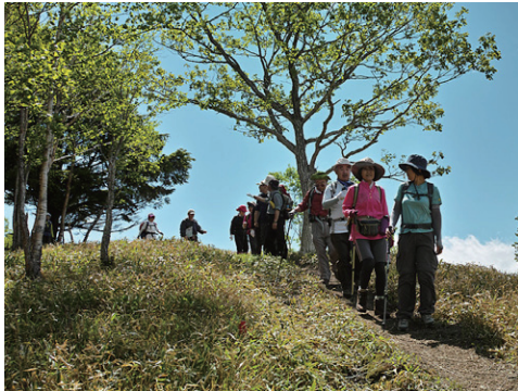
5人ずつ、4グループに別れて杜山を目指す。↑