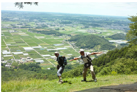
⑦ パラグライダー滑走路にて(10:36) ↑