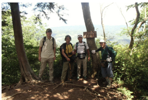
⑧ 晃石山山頂(10:50) ↑