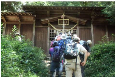
④ 客人(まろうど)神社(08:33) ↑