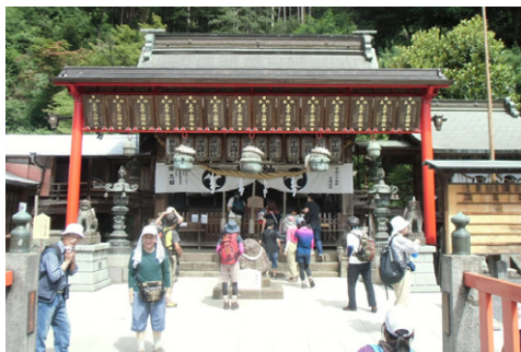
⑤ 太平山神社(09:24) ↑