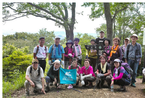
⑨ 馬不入山山頂(12:42) ↑