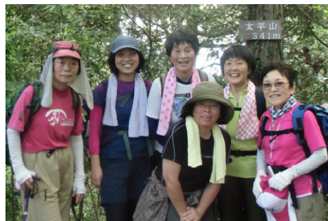
⑥ 太平山山頂(09:49) ↑